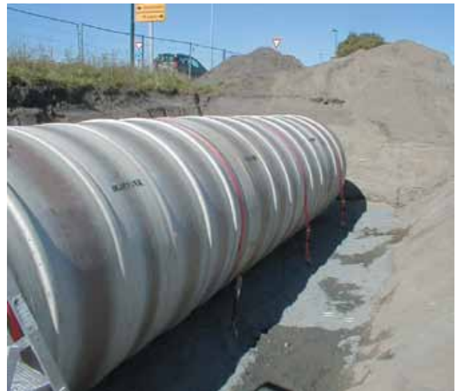
Oljetank for nedgraving.