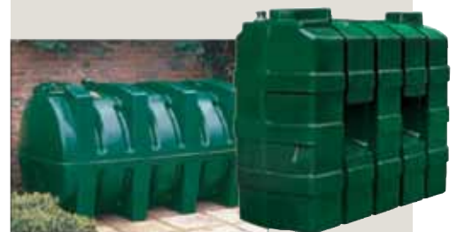
Titan enkeltvegget fyringsoljetank.